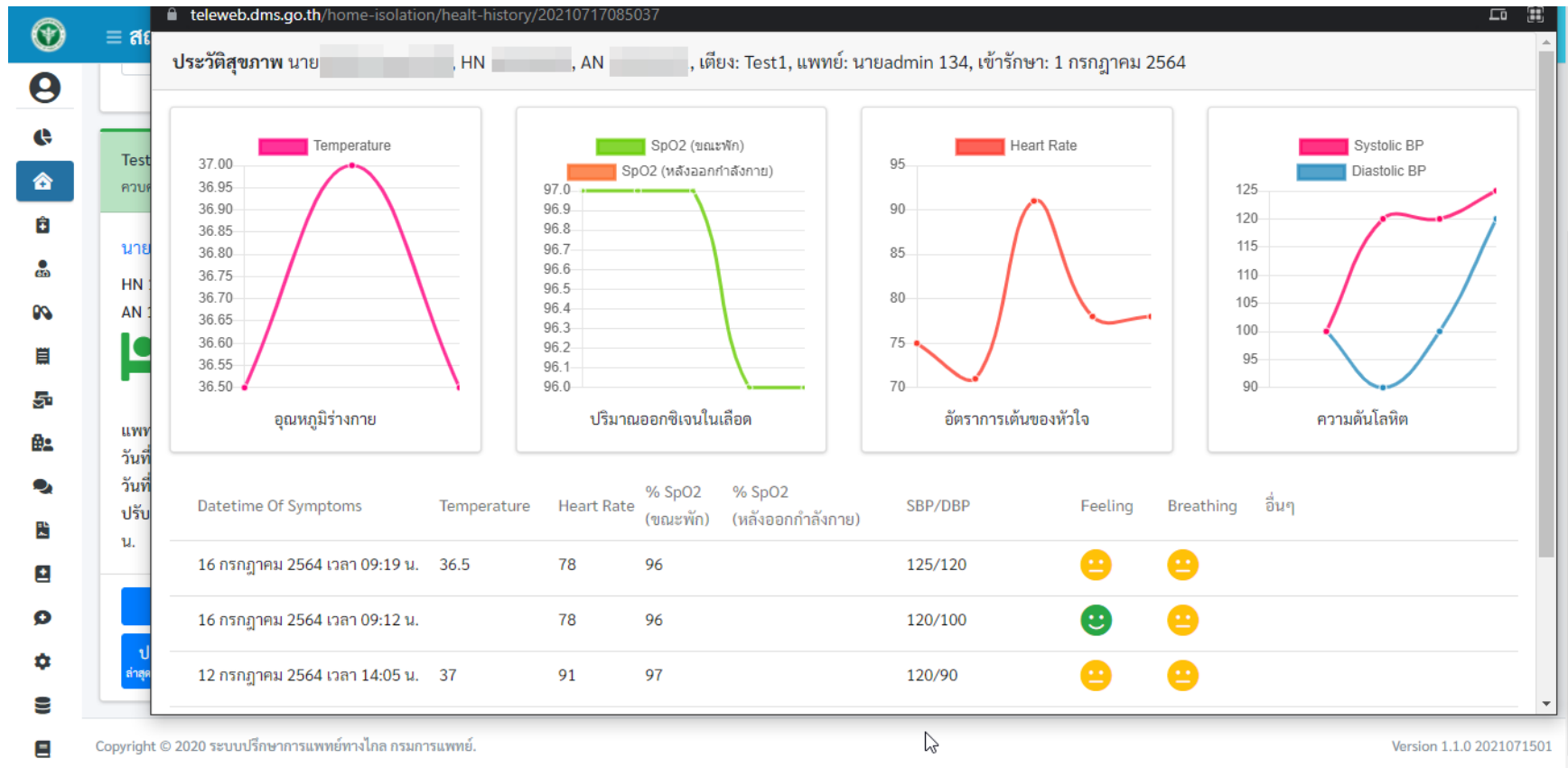
หน้า “ประวัติสุขภาพ”